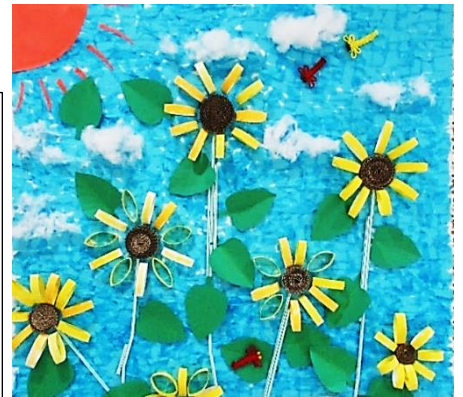
共同作品 ロール芯アート ひまわり