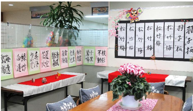
← → 特養・デイホームのご入居者、ご利用者の方々の力作が並びました。

ギャラリー展示にも、いつもボランティアの皆様のご協力を頂き、有難うございます 素敵な作品をどんどんお寄せ下さい、お待ちしております。