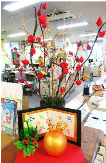
← パンフラワー 矢治晴子先生作