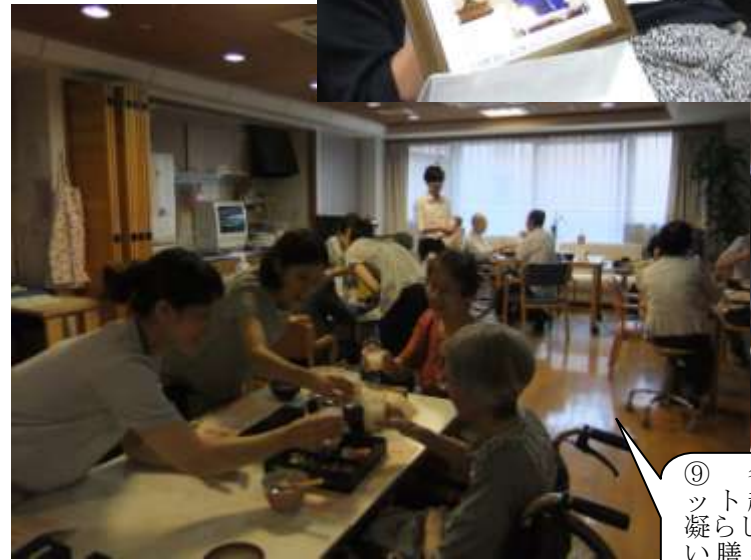
⑨ 各ユニット趣向を凝らして、祝い膳を盛り上げました