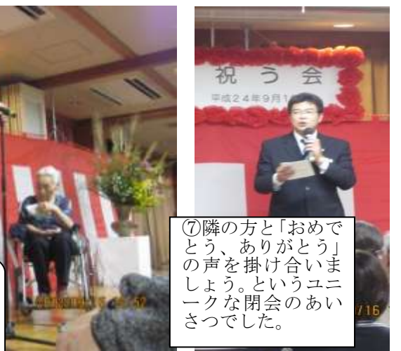
⑦隣の方と「おめでとう、ありがとう」の声を掛け合いました。というユニークな閉会のあいさつでした。