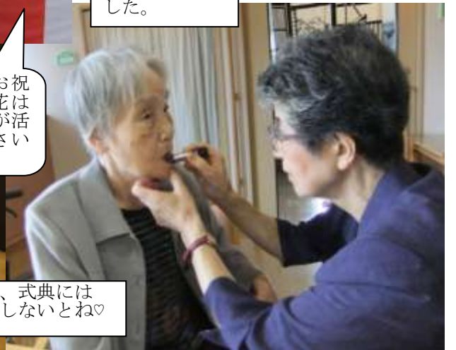
②やはり、式典にはおしゃれしないとね♡