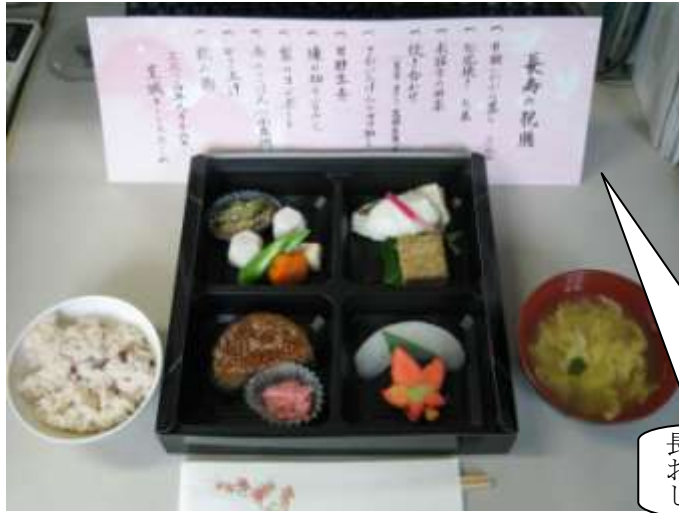
長寿の祝い膳 お品書きは、毎年おなじみ持丸Vo

9月16日、至誠キートスホームで特養の「長寿を祝う会」が行われました。多くのVoさんの協力で楽しく、無事に迎えることができました。Voさんの協力なしには考えられないくらい、キートスにはきめ細かくVoさんが組み込まれています。今年の反省会であげられたのは、「移動がスムーズで早かった」ということです。従来は、入居者とVoのペアが決まると、そのまま席に座っていましたが、今年は職員が会場に待機していたので、入居者と一緒に下りたVoが、また次の方を誘導にあがりました。これは、毎月行われる音楽会の誘導と同じです。普段の事が、ここで発揮され良かったとおもいました。