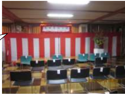
①床には座る方の名前を書いた紙を貼り、着席するとはがします。