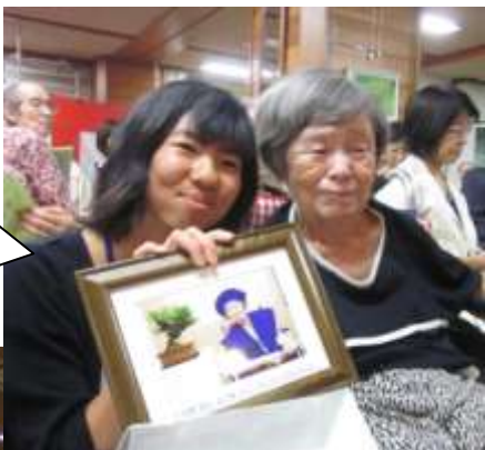
⑧さあ、式典も終わったから、部屋に帰って、おいしい祝い膳を頂きましょうか。