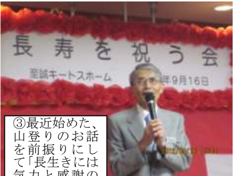
③最近始めた、山登りのお話を前振りにして「長生きには気力と感謝の気持ちが大切」というお話でした。