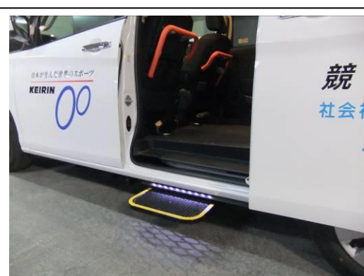
サイドドア乗車補助ステップ