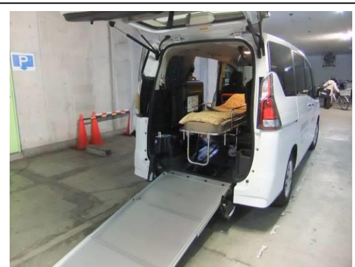
ストレッチャー乗車