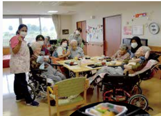
至誠ホームミナナの長寿を祝う会と祝膳

9月は敬老月間です。至誠ホームの各施設・事業所で、長寿のお祝い会を行いました。 今年はコロナ禍のため、例年と異なり、施設では、密を避けるために、ご家族は参加しない形として、一堂に会する式典も行わず、それぞれのフロアやユニットでごじんまりとお祝い会を行いました。 ご家族との面会が制限され、ストレスがある中ではありますが、職員と祝膳を囲んで、楽しい会となりました。