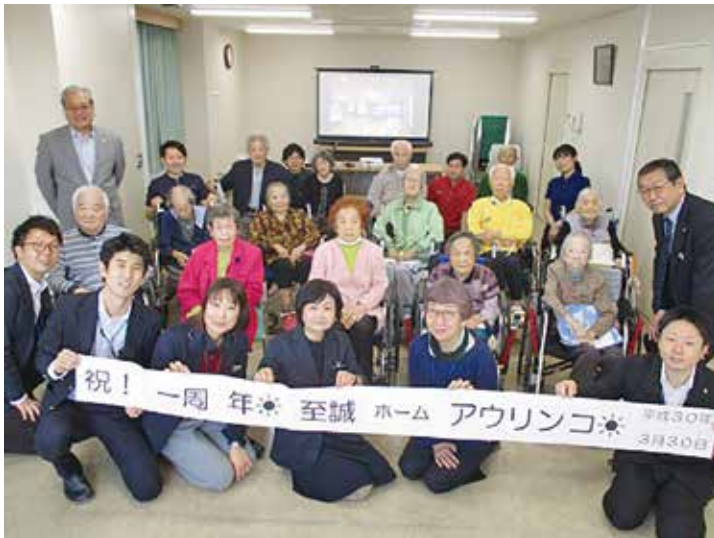
アットホームな式典

現在の日常をご紹介しますと、法人内の児童事業本部障害部門で担当しているまことカフェ クツカはずっかり皆さんの憩いの場として定着しました。また、個別あるいは小グループ活動を