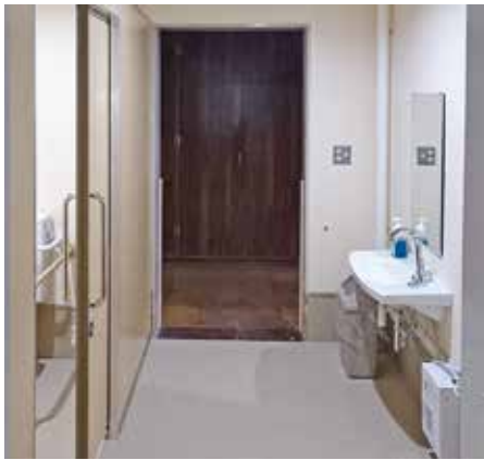
引き戸がつき広くなった居室トイレ

実現に至る経過としては、工事の内容から従来の定員のままで進めることが難しく、定員の変更等も必要となってくるため、さまざまな協議を重ねてアウリンコの開設と一体的な計画となつて考えられ進められてきたものです。具体的な工事の内容については、工