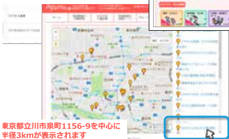
東京都立川市泉町1156-9を中心に半径3kmが表示されます

※在宅医療をお考えの際は、かかりつけ医や、訪問看護ステーション、担当ケアマネジャー等にご相談下さい。