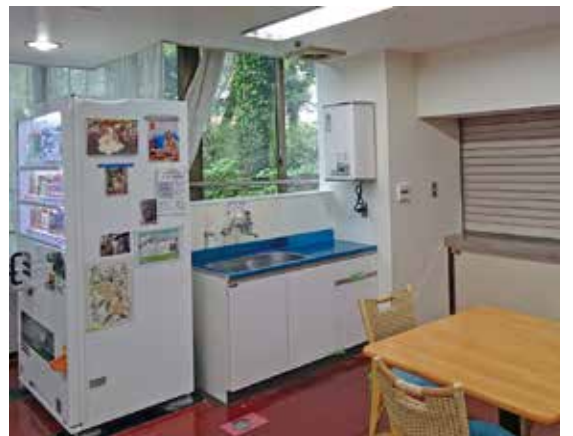
給湯器も新しい衛生的な喫茶コーナー

利用者の皆様には大変ご負担をおかけして申し訳ありませんが、説明を行う度にむしる励まされながら工事を進めてい