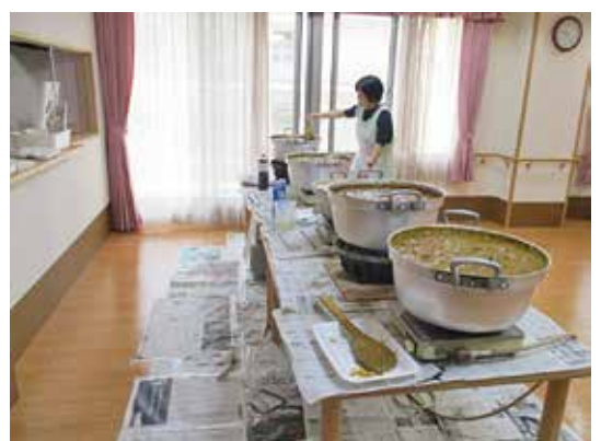
250人分のカレー調理中

「多職種連携」を強く意識して参りました。現在も利用者の直接的なケアだけでなく、マニュアル作成、人材育成など幅広く連携を進めて居ります。