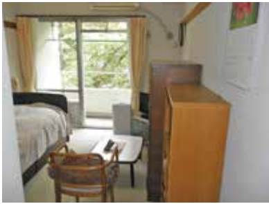
清潔に整頓された個室です