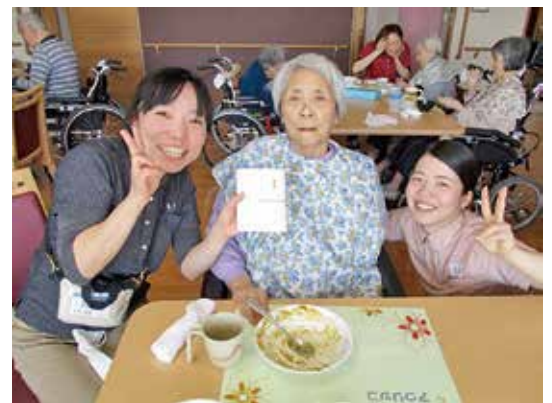
お祝いのお菓子も満足