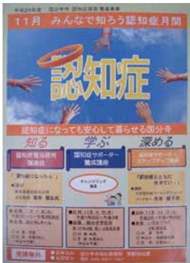
国分寺市内全域に配布された「認知症普及啓発月間」のチラシ