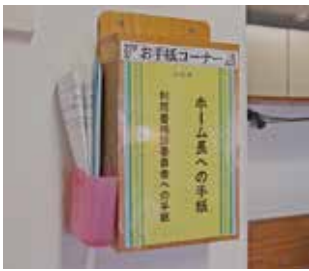
お手紙コーナーポスト