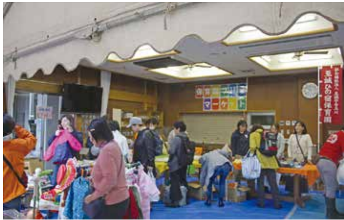
保育事業本部の子ども服リサイクルコーナー