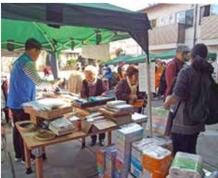
来園者で賑わうバザー (平成28年)