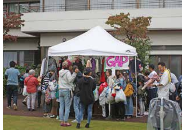
児童事業本部の子ども服コーナー