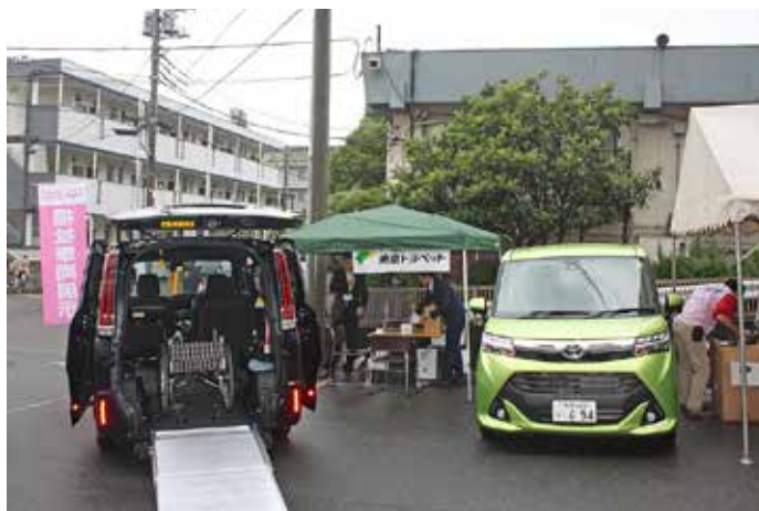
東京トヨペットさんによる福祉車輛展示コーナー