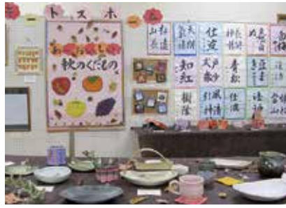
沢山の作品で彩られました (平成28年)

第37回、幸地区文化祭が今年も行われま す。会場は幸学習館で 11月25日、26日の2日 間の短い開催ですが、