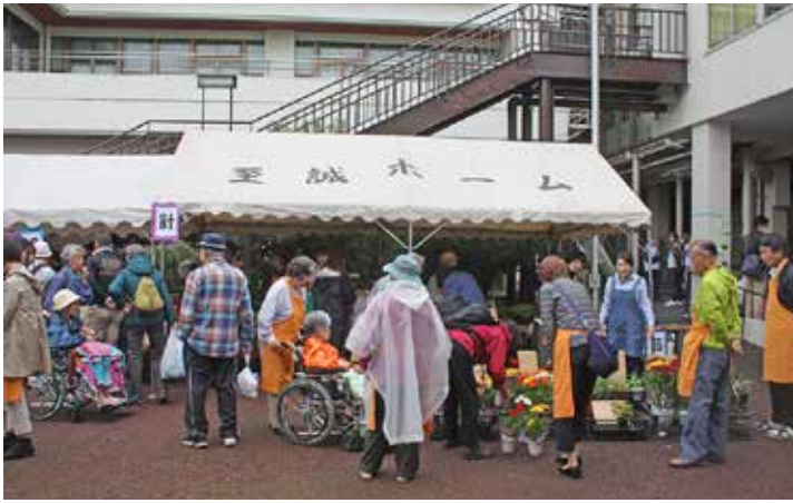
家族会の青空市場も大にぎわい

平成29年10月14日(土)、霧雨が降る中、社会福祉法人至誠学舎立川合同のバザーが大勢の皆様のご理解・ご協力のおかげで今年も開催することができました。至誠ホームとしてのバザーの開催は49