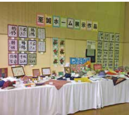
今年は85名の作品が展示されました