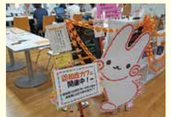
イメージキャラクター「くるりん」がお出迎え