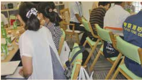
わが町語ろう会の一場面

今後地域包括支援センターほんだは、住民に近い立場で地域に寄り添えるセンターを目指していきたいと考えております。