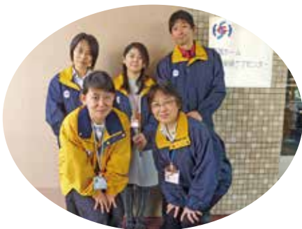
「調布市地域包括支援センター至誠しばさき」のメンバーです。

ない世の中になってきました。民間サービス、地域の助け合い活動、地域サロン活動などサービスも多種多様になっています。調布では近隣住民主体によるサロン活動が盛んになってきました。地域包括支援センターではサロン活動をバックアップする活動をしています。また9月には地域住民、医療・福祉の関係機関と地域包括支援センター至誠しばさきが協働して「認知症の人を地域で見守る」あ