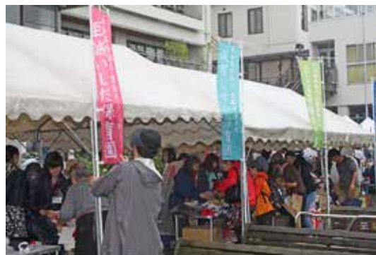
至誠合同バザーの様子、毎年多くの来園者で大盛況。