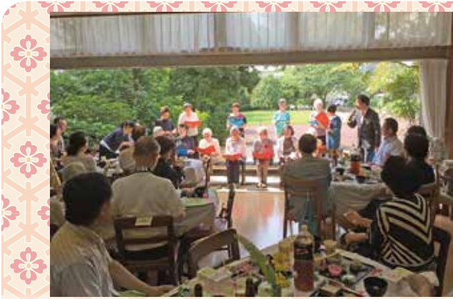
至誠和光ホーム 長寿を祝う会的一幕