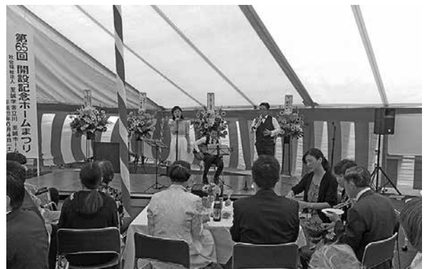
ジャズバンド「まつきり三郎とスイングバイ・ブラザーズ」の皆様