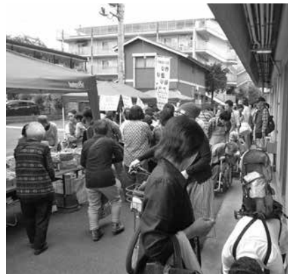
会場は毎年大賑わい (写真は昨年の風景)