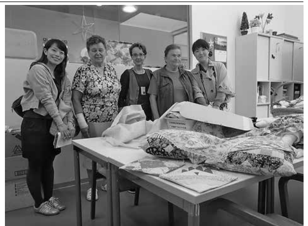
縫い物ボランティアさんと 左端が筆者

また、職員の方々に個別に話を伺っていて、どの職員も「忙しさはあるが、お年寄りの方々のことが好きだから、この仕事は楽しい」とやりがいを感じていることにも感銘を受けました。勤務年数や職種に関わらず、皆さんがそう話されており、それに心を打たれま