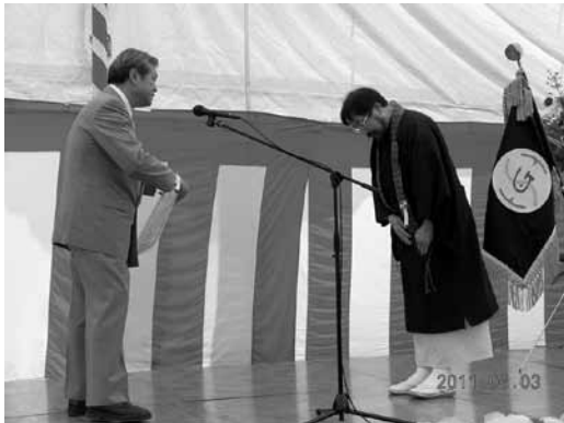
光西寺様へ特別感謝状の贈呈

第一部の式典では、清水立川市長、星野国分寺市長を始め多くのご来賓のご祝辞をいただき、総勢174名にな