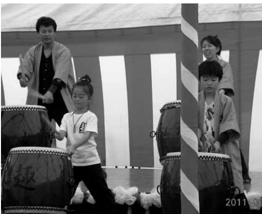
和太鼓「趣」による元気いっぱいの演奏