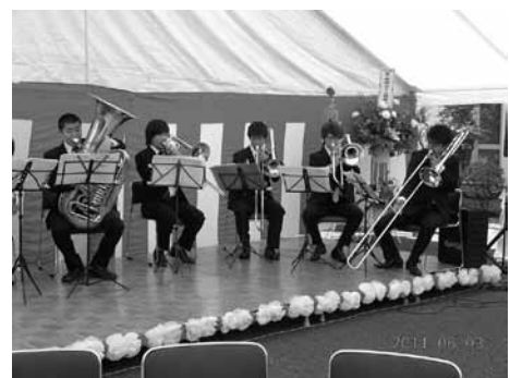
国立音楽大学による吹奏楽十重奏

アトラクションは国立音楽大学の吹奏楽十重奏。ファンファーレから曲目は4つ。会場に明るく和やかな雰囲気を作ってくれました。そして、2つ目は和太鼓「趣」。小学生から大人まで