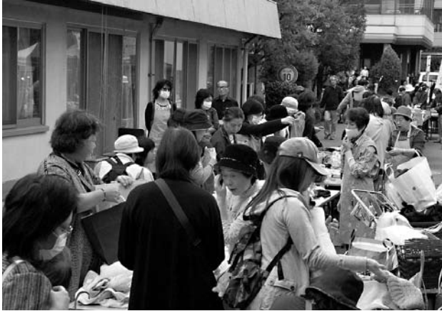
協力出店 毎年にぎわっています