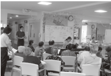
音楽活動の風景 (デイサービス)

中スタートしました。 スタッフ一同試行錯誤の毎日でしたが、国分寺市の福祉計画課、高齢者相談室など関係各課の皆様と、元町地域を中心に高齢者福祉の増進・向上を図るために地元住民で組織された「特定非営利活動法人あおぞら」(以下NPO法人あおぞら)を始め地域の皆様方の暖かなご支援により、重圧はいつしか心地良いものへと変わっていききました。 常に協働のスタンスで私たちの意見に耳を傾け、バックアップして下さる国分寺市の「リーダーシップ・パートナーシップ」と、地域を知り尽くし、さまざまな資源を結集し、