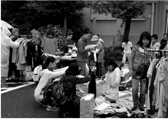
フリーマーケット 「どれにしよう？」

慮させて頂きましたが、地域の皆様のご理解とご協力を頂きまして、混乱することなく、今年も多くの方々にご寄贈をして頂きました。ありがとうございました。