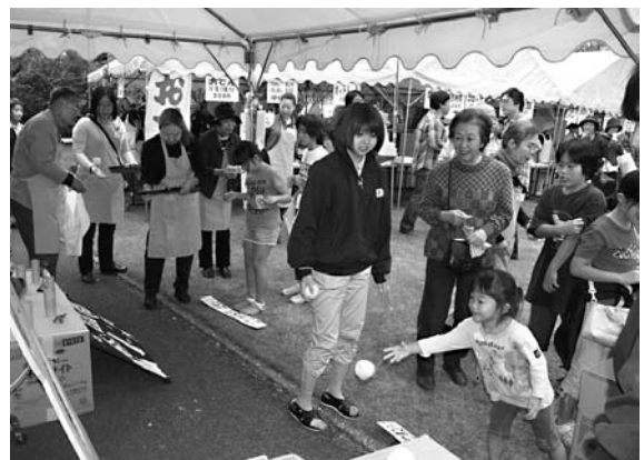
お遊びコーナー 的にはいるかな？

最後に、至誠ホームバザーに協力していただき、支援して頂きましたすべての皆様にお礼を申し上げます。高年齢者福祉事業のために大切に使用させていただきます。本当にありがとうございました。今後共変わらぬご支援をよろしくお願い致します。