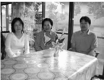
庭の見える明るい活動室とスタッフたち