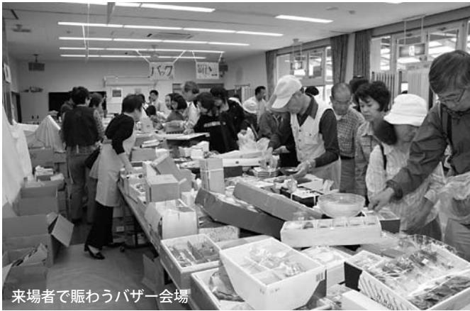
来場者で賑わうバザー会場

あすなる洋裁ボランティアグループ 綾部グループ エクセルシオボランティ アグループ 錦六茶友会 五月会