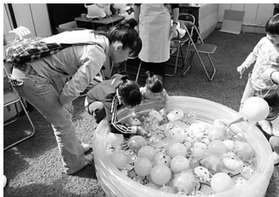
ちびっ子に人気のコーナー

ヤマダ・(株)星野商店・(株)増田屋・東京中 央食品(株)・双葉食品(株)・たくみ・(有)清野 豆腐店・メイトフードサービス(株)・Y ショップ柳澤店・タカナシ販売(株)・西都 ヤクルト販売(株)・(有)三上鯉節店・東西青 果(有)・(株)福吉