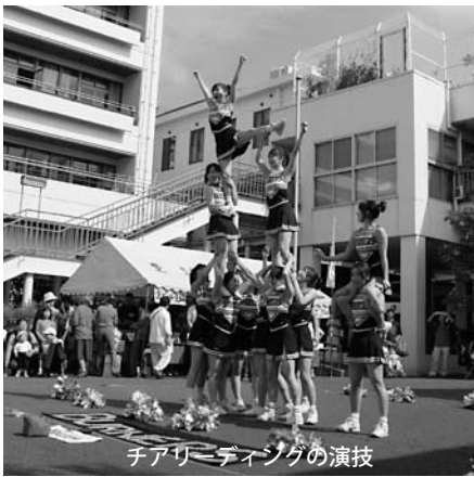
チアリーディングの演技

(旬)食工房707さんによる模擬店では、けやき広場を囲んで様々な出店が並び、大勢の方が料理を楽しんでおられました。またレストランスオミは喫茶コーナーとして営業し、お買物の合間や帰り際にひと休みされる方の憩いの場となりました。