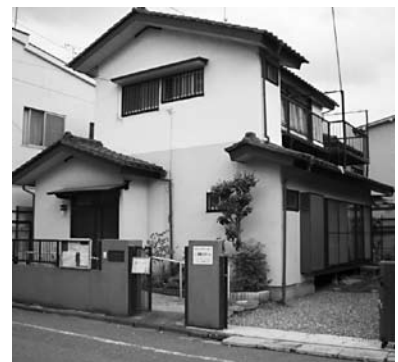
至誠コミホーム全景