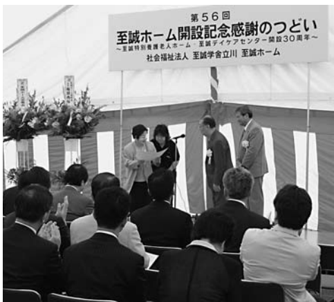
感謝のつどいで感謝状の贈呈