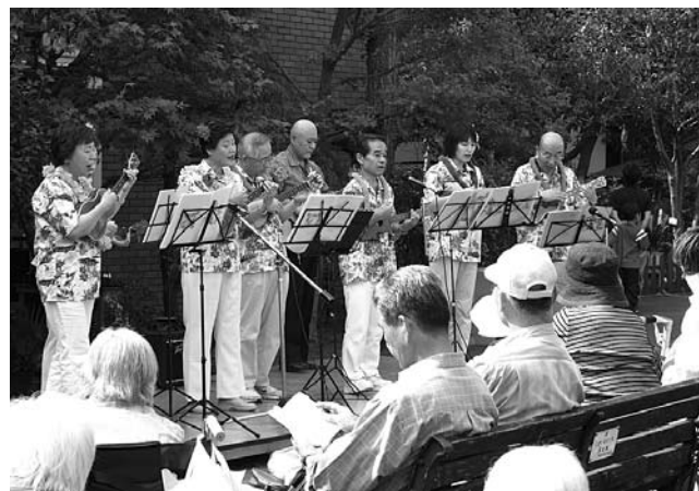
ウクレレの音色にうっとり