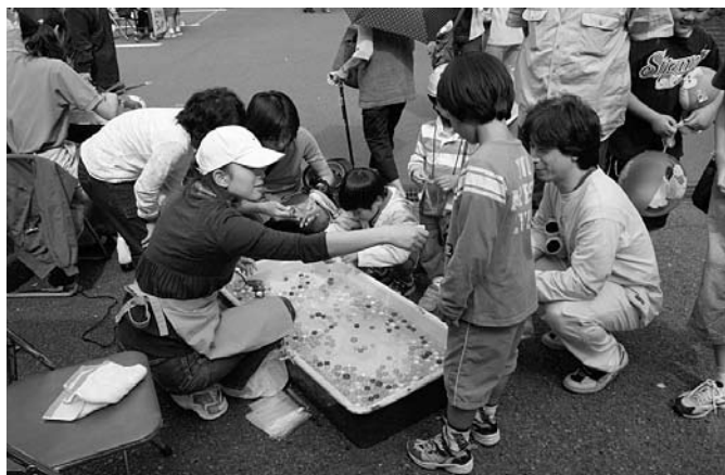
こちらは子どもたちが主役

□ポスター印刷・広告印刷の部 (敬称略) (株)朝雅印刷 (株)立川紙業 □広告協賛の部 (敬称略) (株)多摩健康企画 ニューぴつころ 下田牛乳店 谷書店 三上鯉節店 やな瀬 ホマレヤ キコー商事(株) シェいなば (有)食工房707