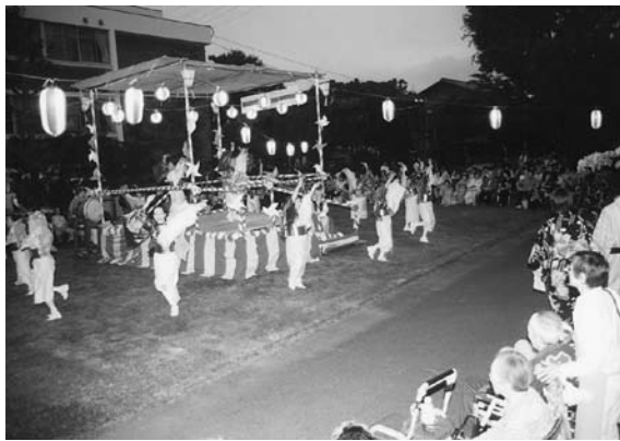
「昭島 YOSAKOI カペラ」

の、夏を迎える花火もとてもきれいに夜空に映っていました。 準備から多くの方のご協力があったおかげで無事、楽しい会を執り行うことができました。また、当日には100名近い方々がボランティアとして来て下さいました。皆様に心から感謝の気持ちを伝えたいと思います。本当にありがとうございました。