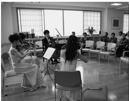
「オープニングコンサート（演奏：アンサンブル・グリモ）」