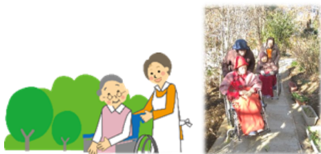
写真： ボランティア さんの活躍で 生活の潤いが 増します。