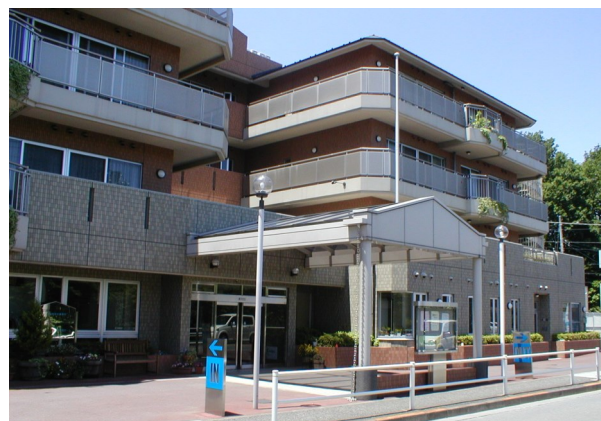
「至誠ホームキートス」の外観

話し相手、クラブ活動指導、縫い物、喫茶、車椅子清掃、行事補助、園芸、朗読、散歩などなど。