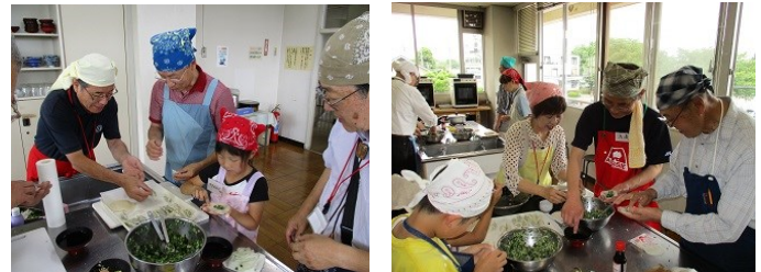
ウエルカム砂川第1回男の料理教室「餃子づくり」