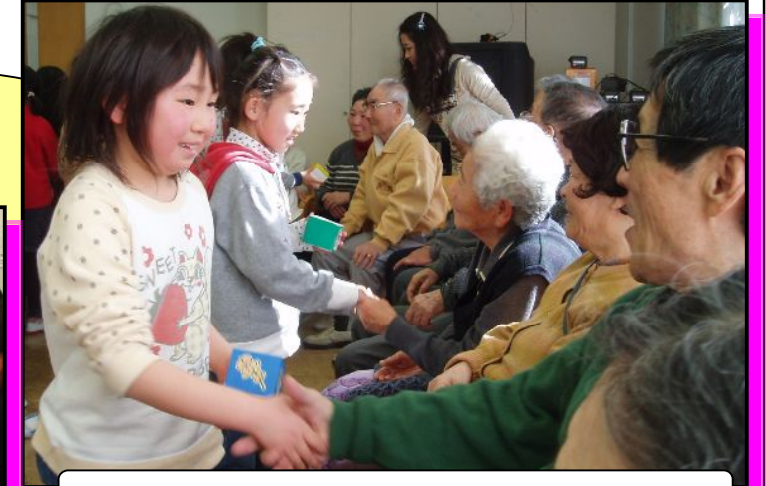
わたしも、わたしもとみんな楽しく握手!!