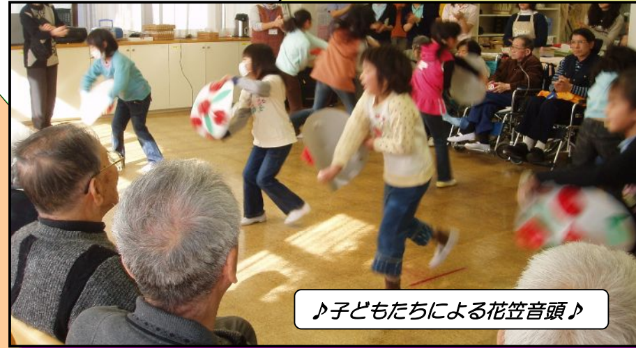
♪子どもたちによる花笠音頭♪