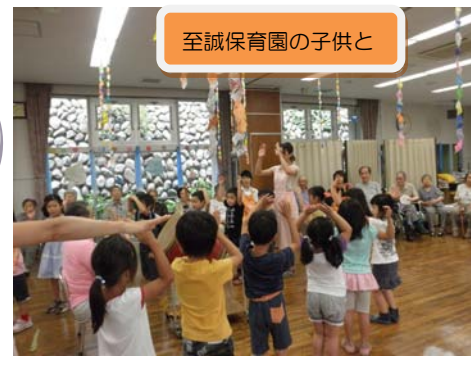
至誠保育園の子供と