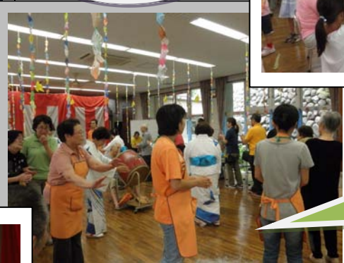
立川音頭・炭鉱節・ 東京音頭とお馴染み の曲に合わせ