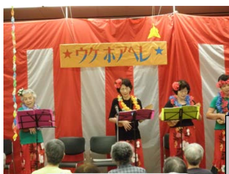
お馴染みのナンバーを ウクレレでハワイアンに

至誠デイホームは「いきいき生活づくりの地域拠点」としてさらなる変化をめざしてまいります。